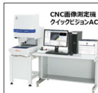
CNC画像測定機 クイックビジョンACTIVEシリーズ